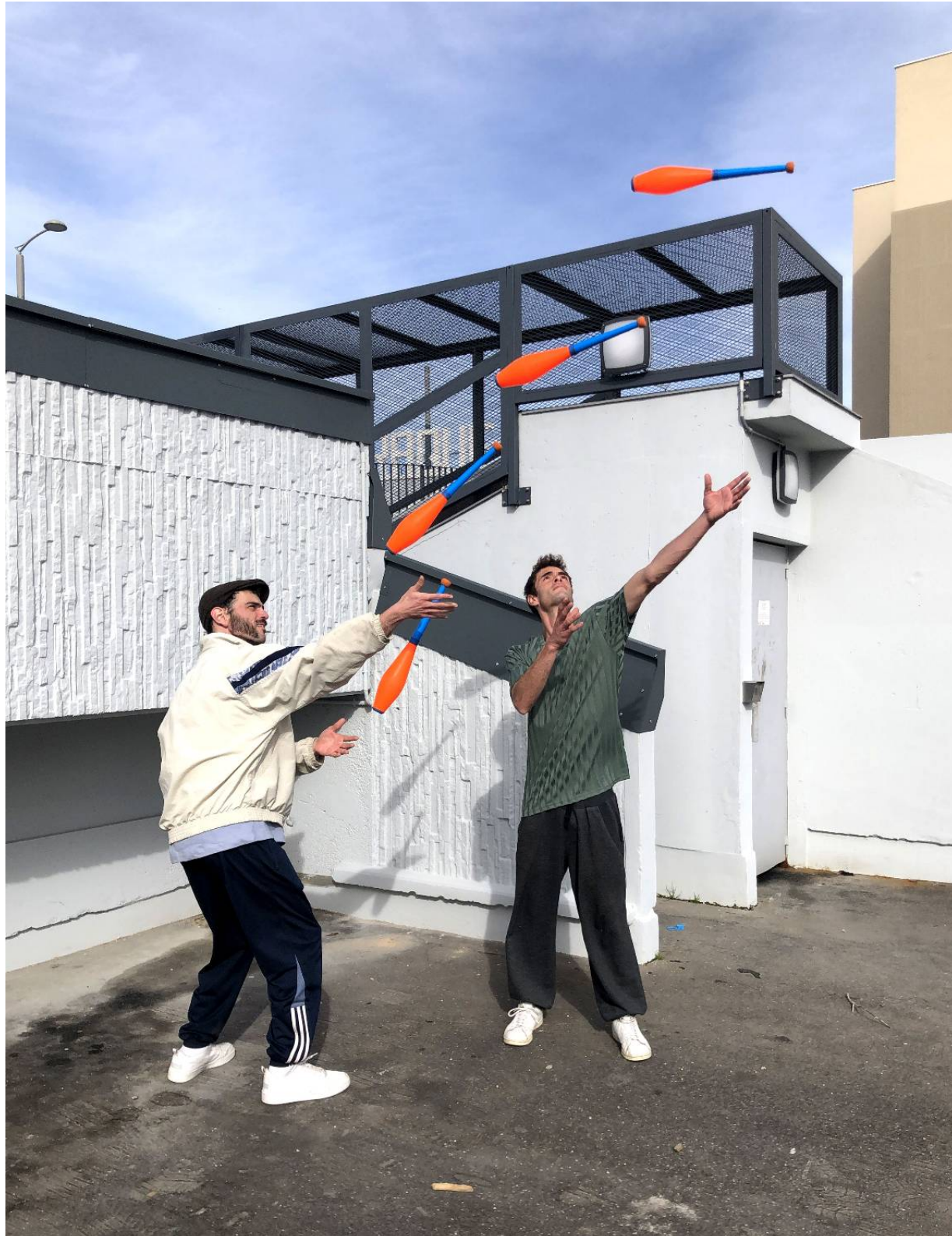
quartier Croix-du-Sud, Reims, 2024